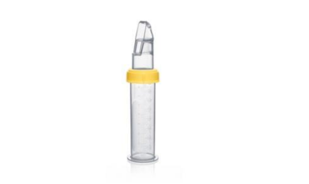
Figura 6: Biberón Cuchara Softcup