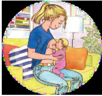
Figura 4: posición de caballito.