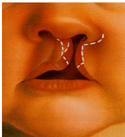
Figura 1: Labio leporino

El labio leporino y la fisura palatina pueden aparecer juntos, siendo más común en niños que en niñas. La mayoría de los bebés que nacen con este problema son sanos y no tienen ninguna otra anomalía congénita. Como consecuencia pueden dar lugar a alteraciones en la imagen, en el desarrollo de la cara y/o en la oclusión maxilodental, en la audición, en la calidad del habla, y ser causa de trastornos psicológicos o del comportamiento 1-3 . Estos defectos se pueden corregir por completo.