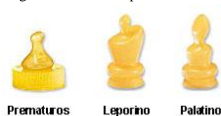
Figura 7: Tetinas especiales