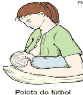
Figura 3: Posición de balón.