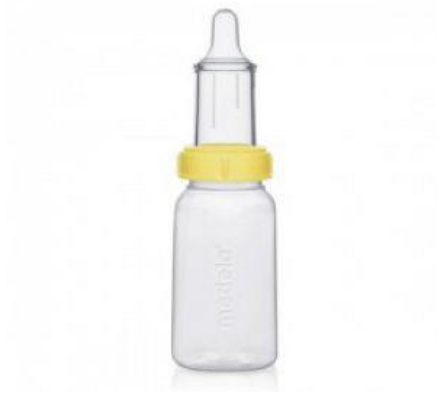
Figura 6: Biberón Special Needs Feeder o Haberman.