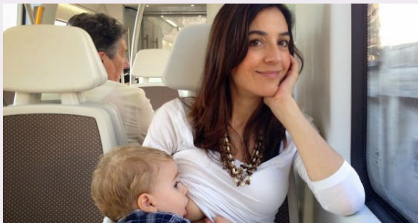
Concurso fotográfico "lactancia materna" Marina Alta.