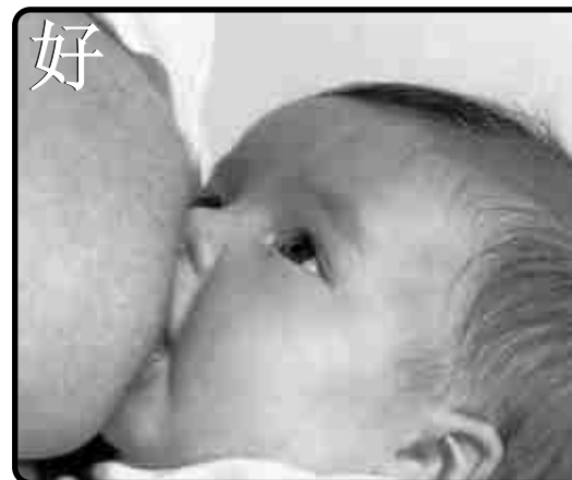
Lactancia Materna de la Consejería de Salud Andalucía 的小册子的介绍