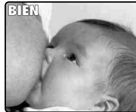
Imagen del folleto de Lactancia Materna de la Consejería de Salud Andalucía.

El bebé abarca con su boca el pezón y buena parte de la areola.