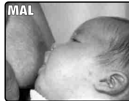
El bebé sólo coge el pezón.

Folleto elaborado por Vía Láctea para celebrar la Semana Mundial por la Lactancia Materna del año 2003. Queremos también, de esta forma, dar nuestra mejor bienvenida a todas las madres que llegan a Aragón desde otros países.