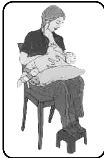
Imagen del folleto de Lactancia Materna de la Consejería de Salud de Andalucía.

La postura correcta Espalda recta. Hombros cómodos y relajados Acercar el bebé a la madre y no al contrario. El bebé se colocará frente a la madre barriga con barriga.